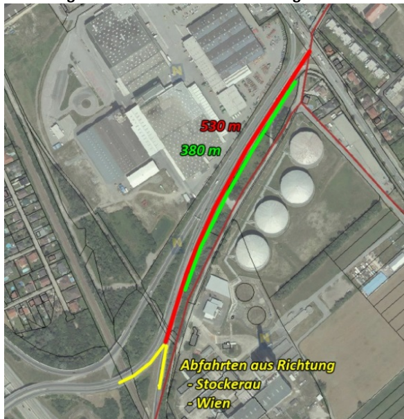
Abbildung 2: Autobahnabfahrt Korneuburg-Ost